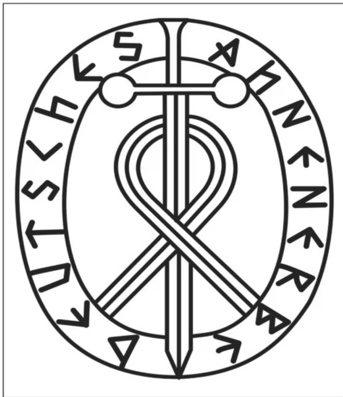
Sigla Deutsches Ahnenerbe, o ramură a SS-ului nazist care s-a specializat în cercetarea antichităților religioase, precum Sfântul Graal și Arca lui Noe.

Motivul exact pentru care Hitler părea să fie în căutarea acerbă a Arcei rămâne un mister care se vrea deslușit; cu toate acestea, nu încapă îndoială că a făcut eforturi concrete s-o găsească. Dosare ale serviciilor de informații întocmite de agenția MI6 9 a Marii Britanii în 1948 afirmă că, în fazele finale ale războiului, din Turcia veneau zvonuri cum că personalul militar german era implicat la acea vreme într-un program secret care presupunea lansarea deasupra Muntelui