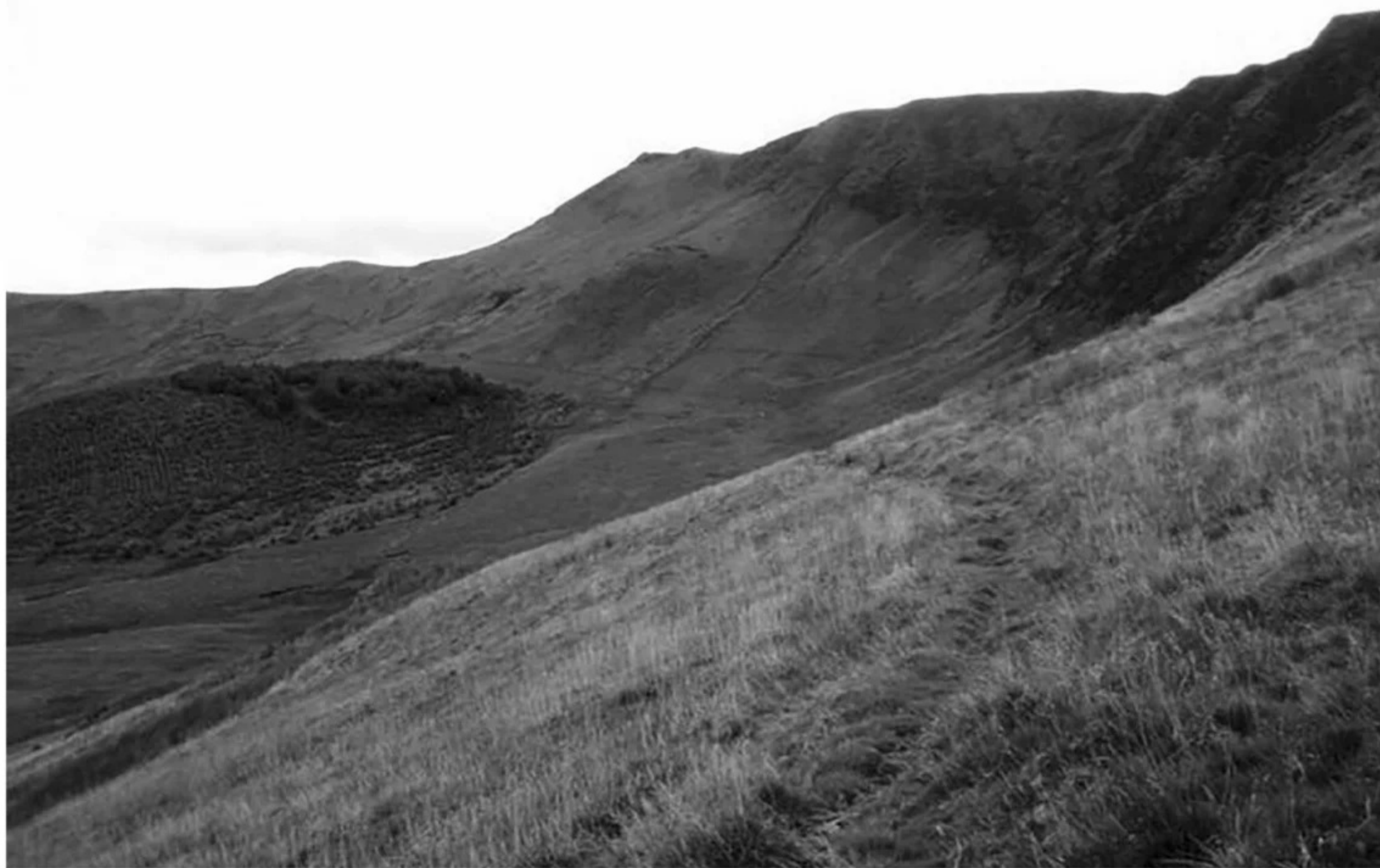
Potecă de-a lungul Munților Berwyn din Țara Galilor, unde se spune că un OZN s-a prăbușit în 1974.

organizații cunoscute sub numele de Northern UFO Network 4 , sau NUFON. Conceptul inițial al NUFON trebuia să fie un fel de schemă de legătură care să aducă laolaltă grupurile locale din zona de nord și din Midlands.”